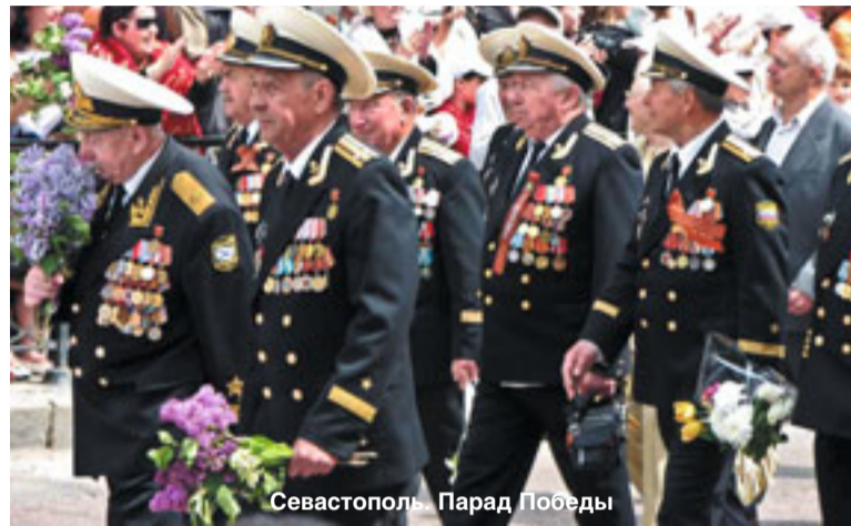
Севастополь. Парад Победы