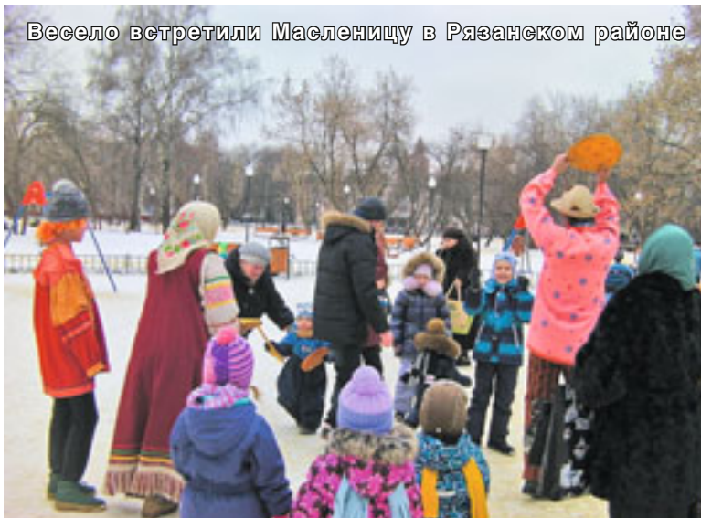
Весело встретили Масленицу в Рязанском районе

31 марта, вторник. 08.40 – Часы. Изобразительны. Вечерня. 17.00 – Великое Повечерие. Утренняя. Свт. Кирилла, архиеп. Иерусалимского.