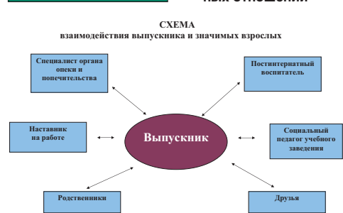
СХЕМА межведомственного взаимодействия в решении вопросов социальной (постинтернатной) адаптации выпускников

Социальная адаптация – это успешное усвоение социальных ролей в системе общественных отношений