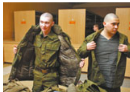
Новая военная форма легка и удобна как в повседневных, так и в боевых условиях

Служба в Вооружённых Силах – важный этап в биографии каждого мужчины. Здесь молодые люди проходят не только хорошую школу жизни, но и приобретают настоящих друзей, крепнут физически и духовно, мужают, им доверяют боевое оружие. Долг, честь, служба Отечеству – вот главные составляющие мотивации военной службы.