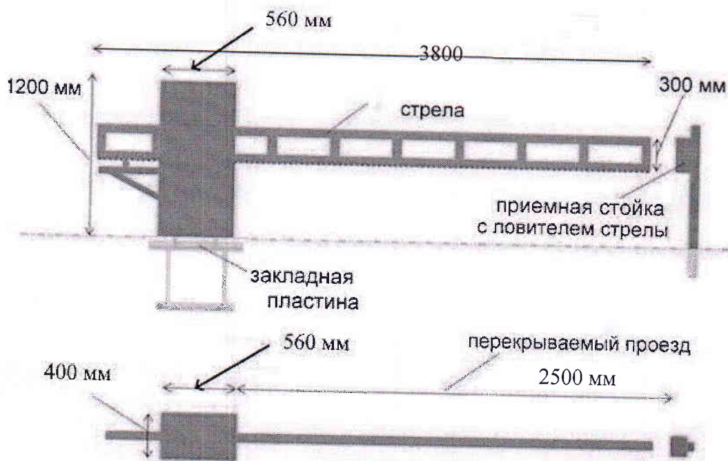
Рис. 2. Габаритные размеры